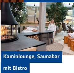
Kaminlounge, Saunabar mit Bistro